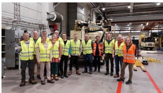
Ylä-Savon peruskoulujen kädentaitojen opettajat Normet Oy:n vieraana 17.11.2022