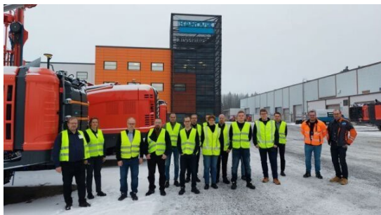
TeknoHUB väki Tampereen Sandvikilla